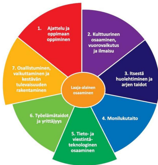
KUVA 1. Tiedot, taidot, arvot ja asenteet yhdistyvät laaja-alaisessa osaamisessa.

Opettaja auttaa oppilaita laaja-alaisen osaamisen taitojen tiedostamisessa ja ohjaa niiden kehittymistä. Omien taitojen tiedostaminen vahvistaa pystyvyyden tunnetta ja innostaa oppimaan. Laaja-alaisen osaamisen taidot otetaan huomioon oppiaineiden arvioinnissa. Oppilaille ja huoltajille annetaan tietoa osaamisen edistymisestä erityisesti nivelkohdissa.